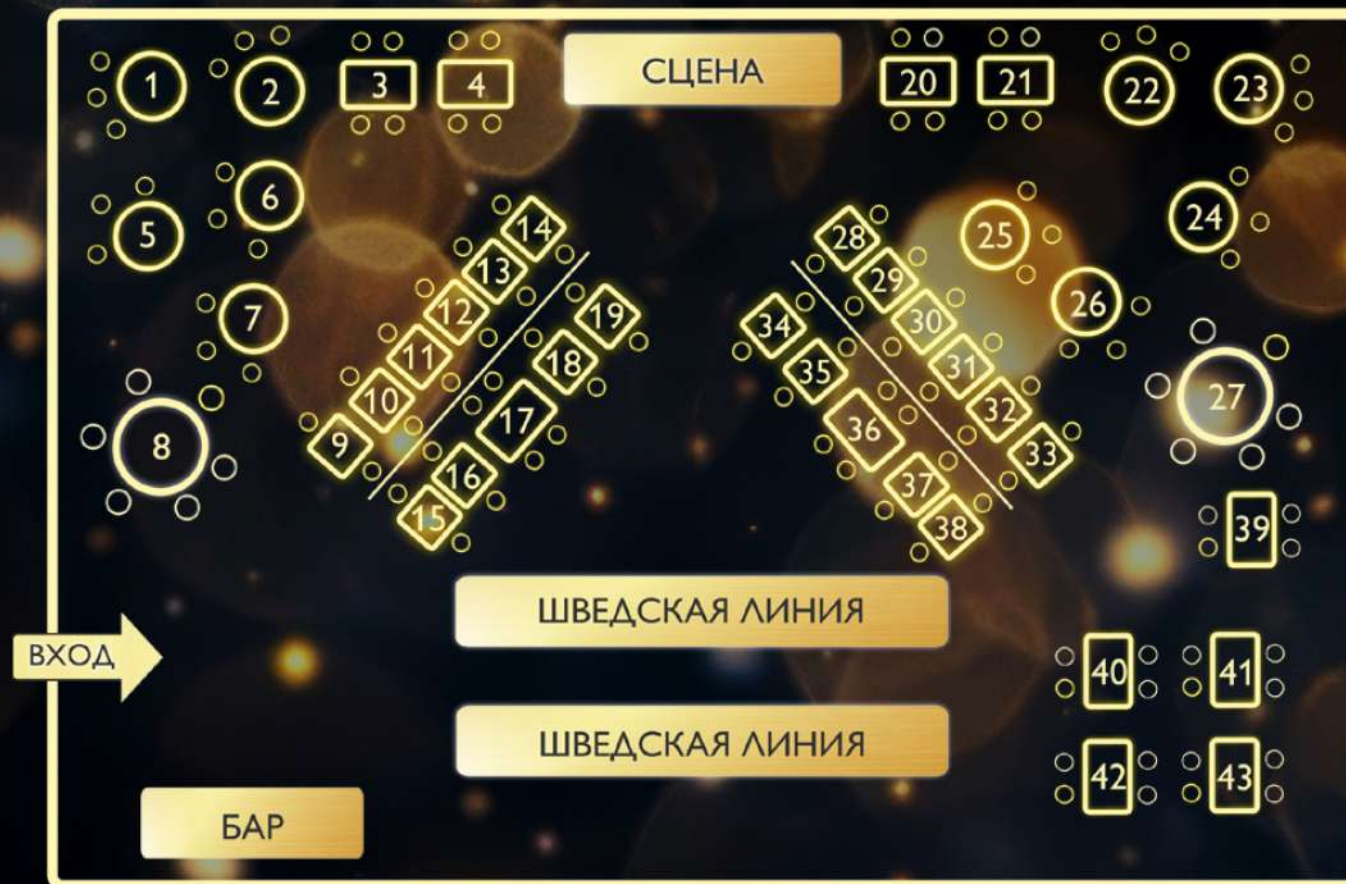
Схема зала изображена схематично и может отличаться от фактической. Отель оставляет за собой право изменить стоимость предложения и скорректировать схему.

В стоимость включен алкоголь безлимитно: игристое, вино красное/белое, водка, бренди, кофе, чай, безалкогольные напитки